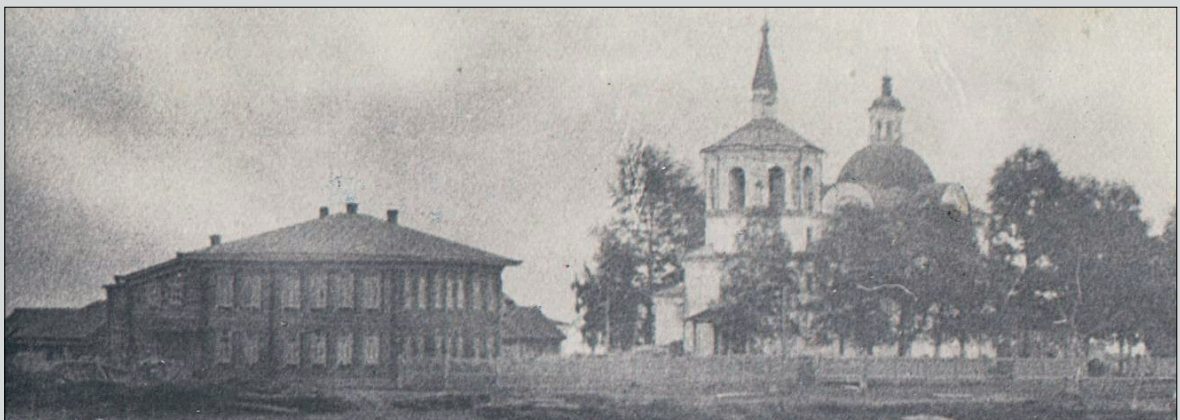
Крестовоздвиженский собор в Нарыме.