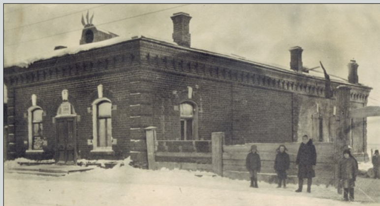
Родовое «гнездо». Усадьба Родюковых в Нарыме. Ул. Куйбышева, 6 (бывшая Крестовоздвиженская).