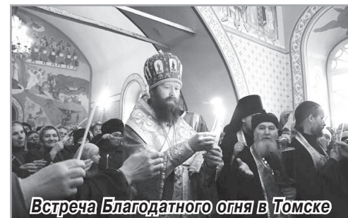
Встреча Благодатного огня в Томске

В этот праздник в церкви положена особая, более торжественная служба, нежели в другие праздники. Утренняя начинается ровно в полночь с субботы на воскресенье. Пред началом ее, священнослужители, облачившись в белые одежды, вместе с верующими, при колокольном звоне, с возожженными свечами, с крестом и иконами идут вокруг храма (совершают Крестный ход), в подражание женам-мироносицам, пришедшим рано утром ко гробу Спасителя. Во время Крестного хода все поют: «Воскресение Твое, Христе Спасе, Ангелы поют на небесах: и нас на земли сподоби чистым сердцем Тебе славить». Начальный возглас утрени делается пред затворенными дверями храма, при этом много раз поется тропарь: «Христос Воскресе из мертвых, смертью смерть поправ, и сущим во гробех живот даровав!». И с пением сего тропаря все входят в залитый полным светом храм.