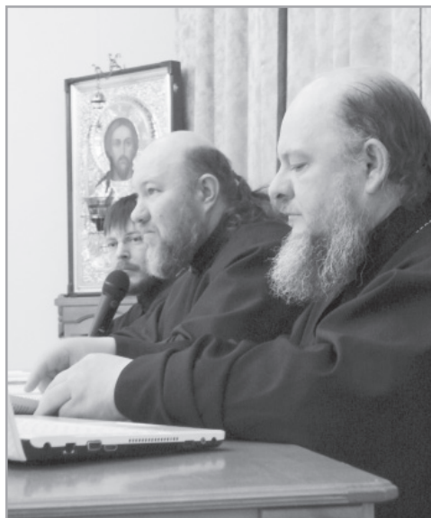
мом, которого не достает православным апологетам, не бывшим в «шкуре» неопротестанта.

На сайте k-istine.ru Вашему вниманию предлагаются материалы их выступлений, уникальность которых состоит в том, что это не просто взгляд изнутри бывших адептов на неопротестантизм, это его осмысление с точки зрения служения ими православными священниками. Вы познакомитесь с действительно глубоким анализом качественных различий между Православием и протестантизмом, которого не достает православным апологетам, не бывшим в «шкуре» неопротестанта.